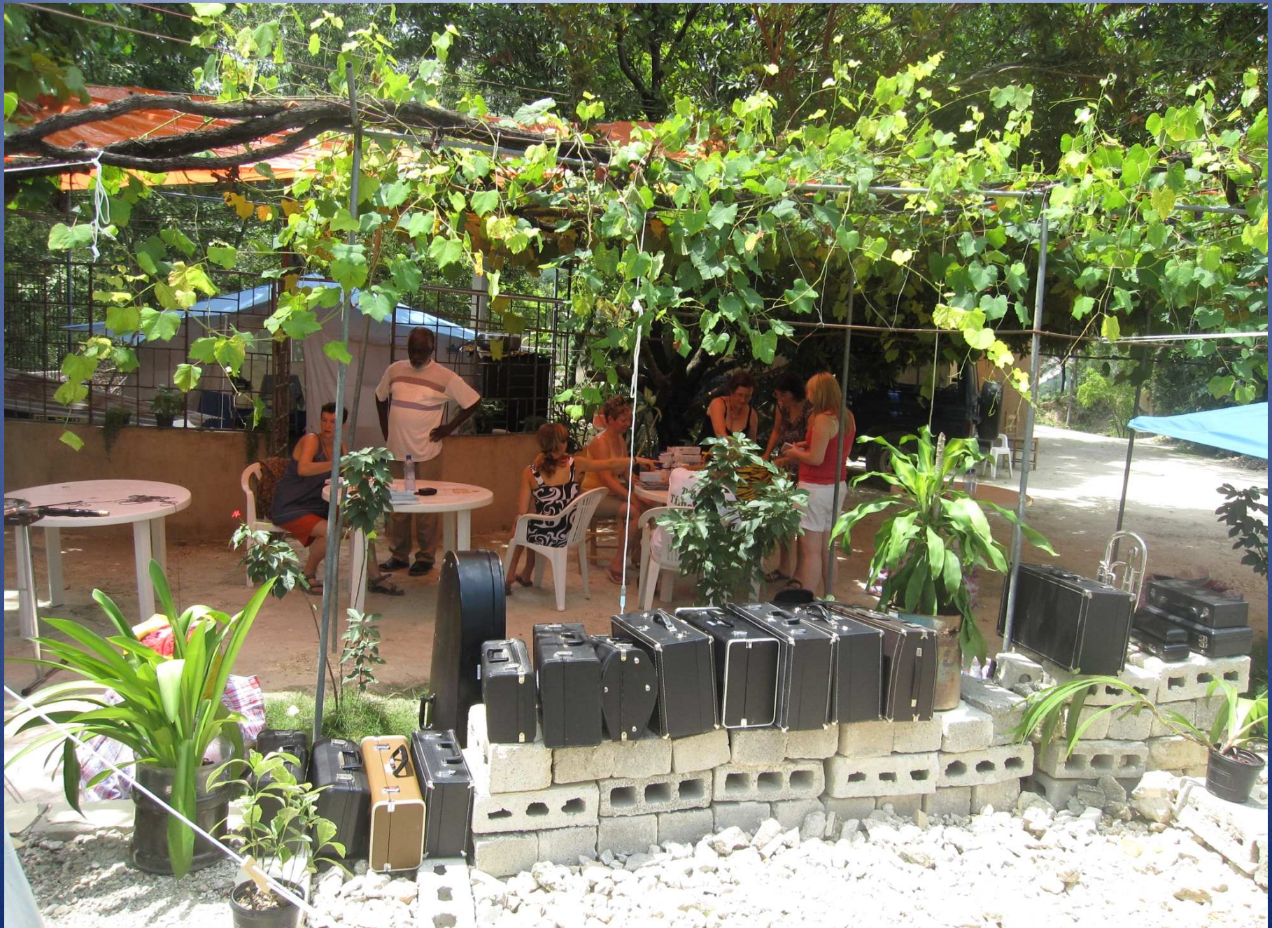
Voilà 30 nouveaux instruments