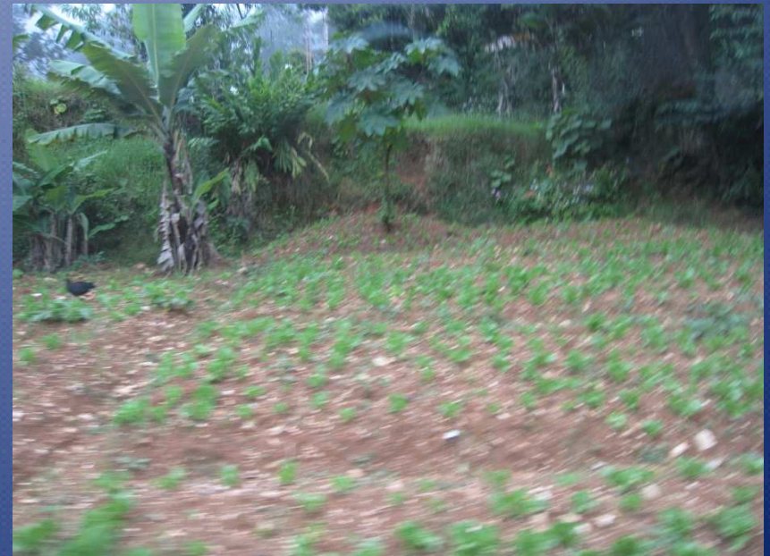
Une plantation de salades