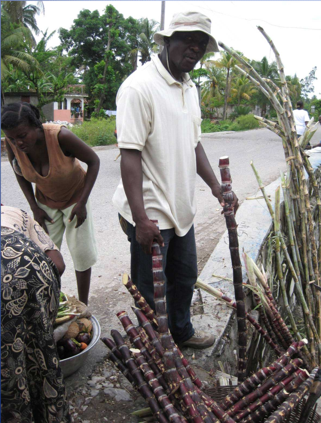
La canne à sucre