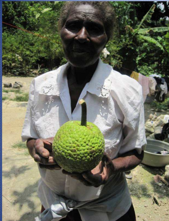
Une châtaigne: fruit de l'arbre véritable