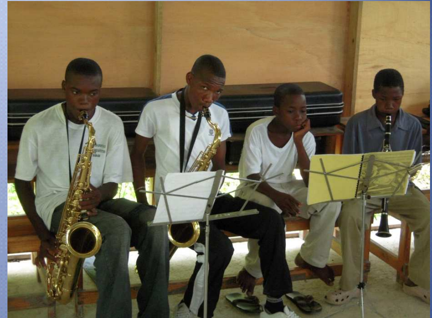
Répétition de la fanfare avec les quelques instruments à disposition