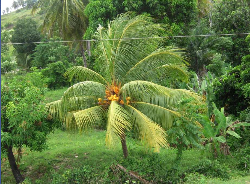
Des noix de coco