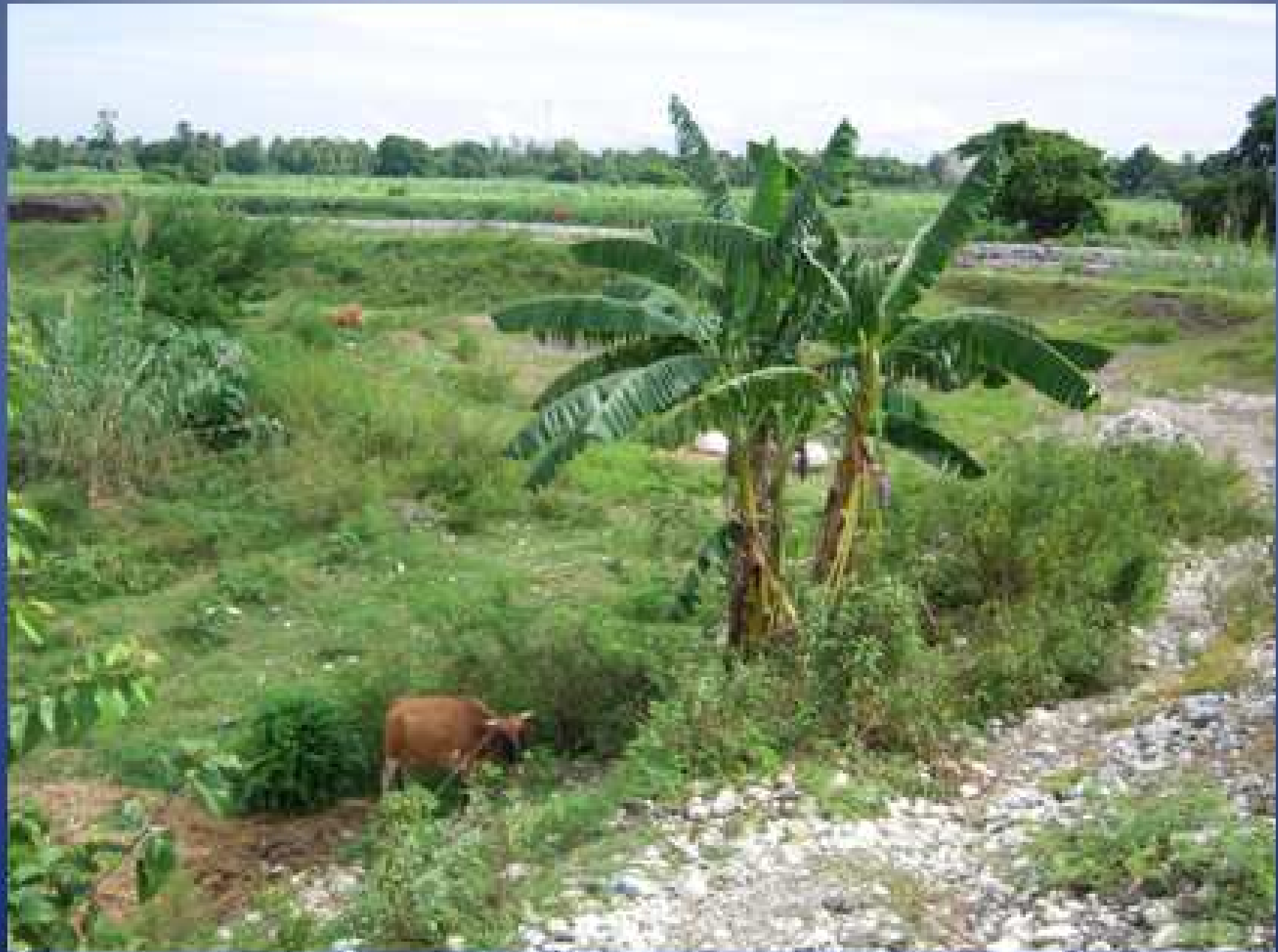
Epicentre du séisme