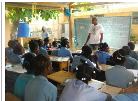
Séance de sensibilisation à l'occasion de la journée mondiale contre le travail des enfants

Ces activités sont principalement destinées aux enfants du Foyer et visent à vulgariser les notions de droits de l'enfant en vue de créer une prise conscience chez l'enfant. Elles se concrétisent à travers la projection de vidéo, des séances d'animation participative et la célébration des journées internationales liées à la problématique de l'enfance comme la journée internationale de l'enfant (20 novembre) et la journée mondiale contre le travail des enfants (12 juin). Par exemple Le Foyer a marqué la journée du 12 juin 2012 en réalisant un moment de réflexion pour les enfants sous le thème « Nou vle travay san maltretans » (Nous voulons travailler sans être maltraités). Les enfants ont