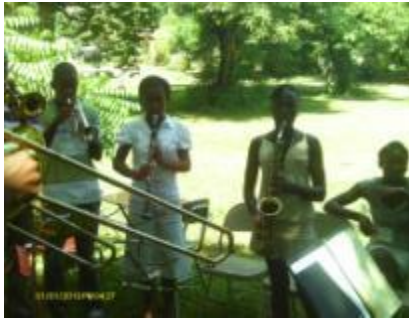
Musique (jeunes en répétition)

L'école des talents est née dans la foulée des initiatives suite au séisme du 12 janvier 2010. À l'origine elle devait permettre aux enfants du Foyer et des communautés avoisinantes de diminuer le stress né du traumatisme du 12 janvier. Très vite, cette section du Foyer était devenue un véritable instrument au service du plaidoyer contre la domesticité en permettant aux enfants de participer eux-mêmes à l'avancement de leur cause. Au cours de l'année 2012, l'école des talents a accompagné le CASE et a agrémenté beaucoup d'activités du Foyer, entre autres :