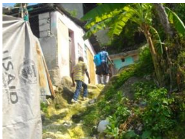
Membre du CASE en visite chez une famille d'accueil