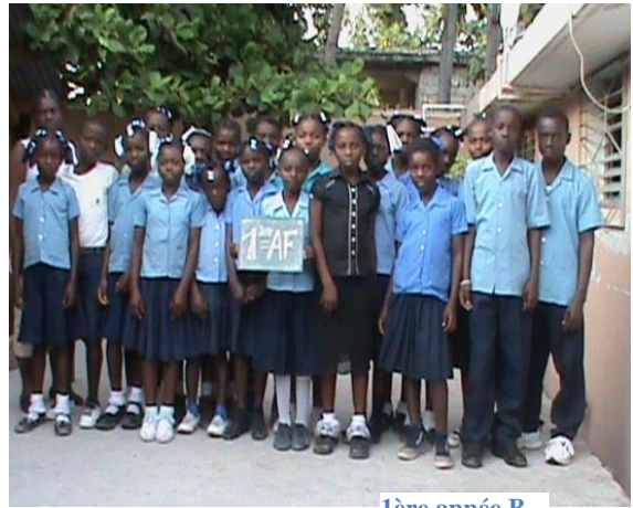
1ère année B