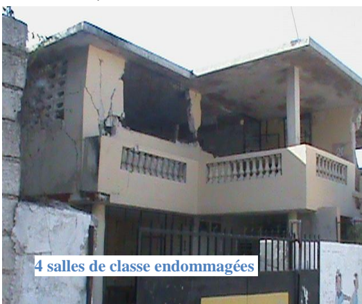
4 salles de classe endommagées

psychologiquement les enfants et de les accompagner dans ce moment si difficile et si perplexe. Une intervention dans ce sens s'avérait plus qu'urgente, sinon on aurait enregistré des cas de troubles socio-psychologiques terribles.