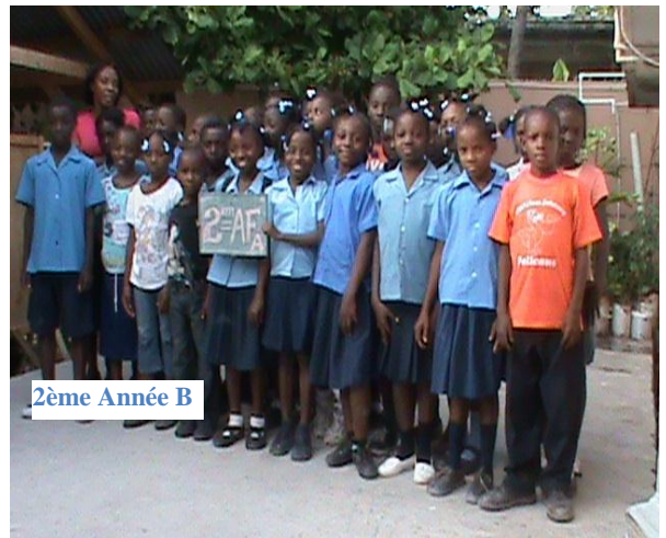
2ème Année B