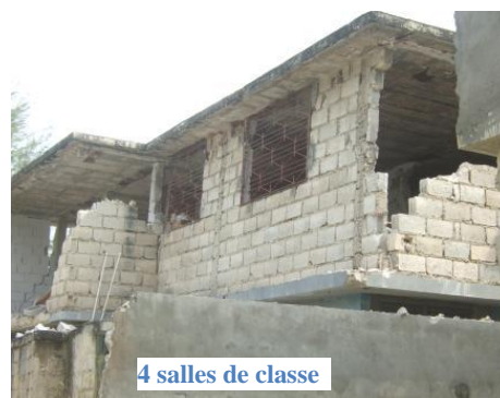
4 salles de classe

Ils ont participé à la mise en place de 6 centres anti stress dans la zone de Rivière Froide hormis le FMS à Brochette avec un appui de personnel encadreur, construction d'un hangar pour palier à la perte de 4 salles de classe. Le personnel a aussi bénéficié d'une formation en psychothérapie. En octobre 2010, avec l'apparition du cholera en Haïti, ils ont fournis des produits tels : le chlore, savon et sérum oral. En décembre 2010, une rencontre de thérapie a été organisée au local de la coordination au Canapé vert en faveur les membres du personnel de tous les partenaires. Des cadeaux ont été distribués.