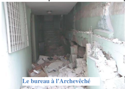
Le bureau à l'Archevêché

Cette année le fonctionnement a été le plus difficile à gérer suite au passage du séisme dévastateur qui a causé beaucoup de dégâts particulièrement au Foyer Maurice Sixto.