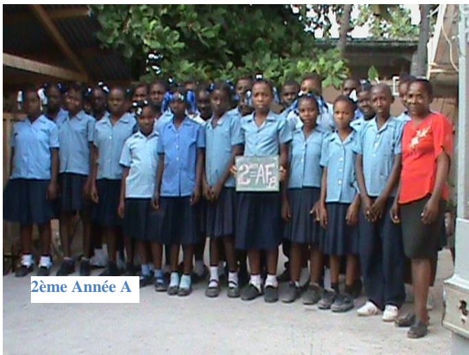
2ème Année A